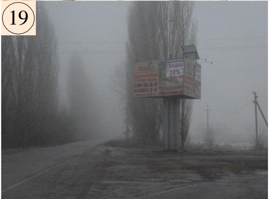
Воронежская область, Бобровский район (М Дон "Бобров-Таловая-Новохоперск км.32+720 (право " )