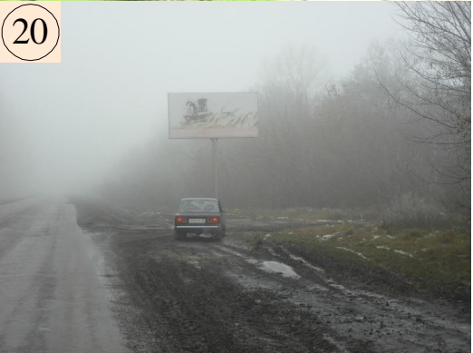
(М Дон "Бобров-Таловая-Новохоперск км.10+650 (лево " )