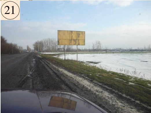
(М Дон "Бобров-Таловая-Новохоперск км. 12+100 (право " )